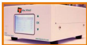
DVLS 3 Simply, Smart

El DVLS 3 se instala en el horno del GC para la monitorización continua de las concentraciones de H 2 en el aire del horno. La concentración de gas medida se muestra en la pantalla LCD del controlador externo. Cuando la concentración de Hidrógeno alcanza el nivel definido por el usuario, por lo general entre el 25% y el 50% del LEL (equivalente al 1% -2% en volumen de H 2 ), la pantalla LCD empieza a parpadear, se transmite una señal acústica y el gas portador se conectará automáticamente a un gas inerte.